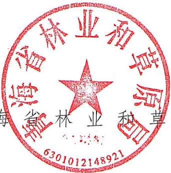
青海省林业和草原局