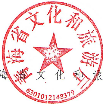
青海省文化和旅游厅