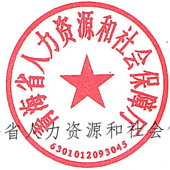
青海省人力资源和社会保障厅