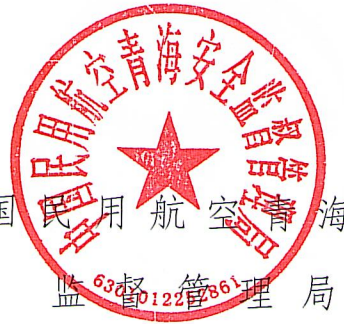
中国民用航空青海安全 监督管理局