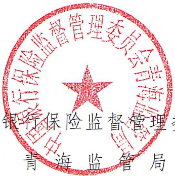
中国银行保险监督管理委员会 青海监管局