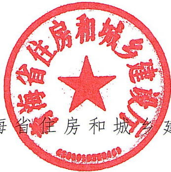
青海省住房和城乡建设厅