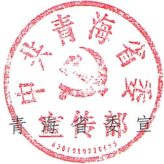
中共青海省委宣传部