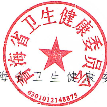
青海省卫生健康委员会