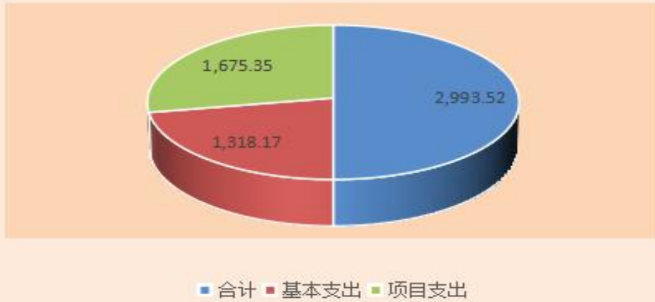
支出总表图(单位：万元)

省退役军人事务厅本级 2023 年支出预算 2993.52 万元，其中：基本支出 1318.17 万元，占总支出预算 44.03%；项目支出 1675.35 万元，占总支出预算 55.97%。